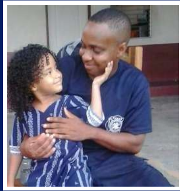
Cabo Iro Anthony Ashly Z.R. Bocas del Toro