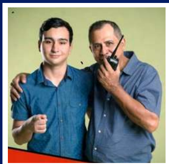
Mayor Javier Vergara Z.R. Panamá