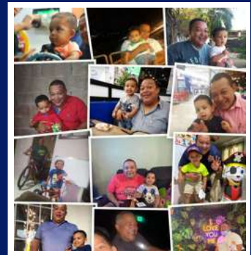
Mayor Ricardo Tack Z.R. Panamá