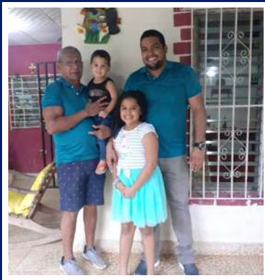
Mayor Félix Estrada Z.R. Chiriquí